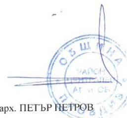
Схема за разполагане на СПО - павилион за кафе, безалкохолни напитки и готови закуски, с площ до 30 кв. м в УПИ I - озеленяване, кв. 204а, по плана на Втора градска част, гр. Пловдив, бул. "Шести септември" - пл. "Кочо Честименски"